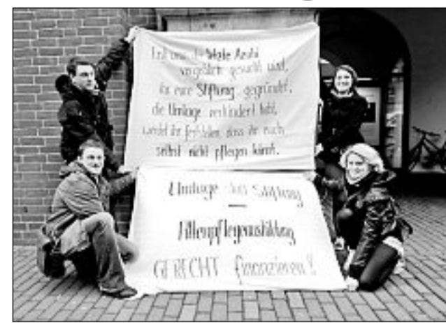
PROTEST: Vor der Marktkirche halten Demonstranten Transparente hoch – sie sind gegen die Stiftung.